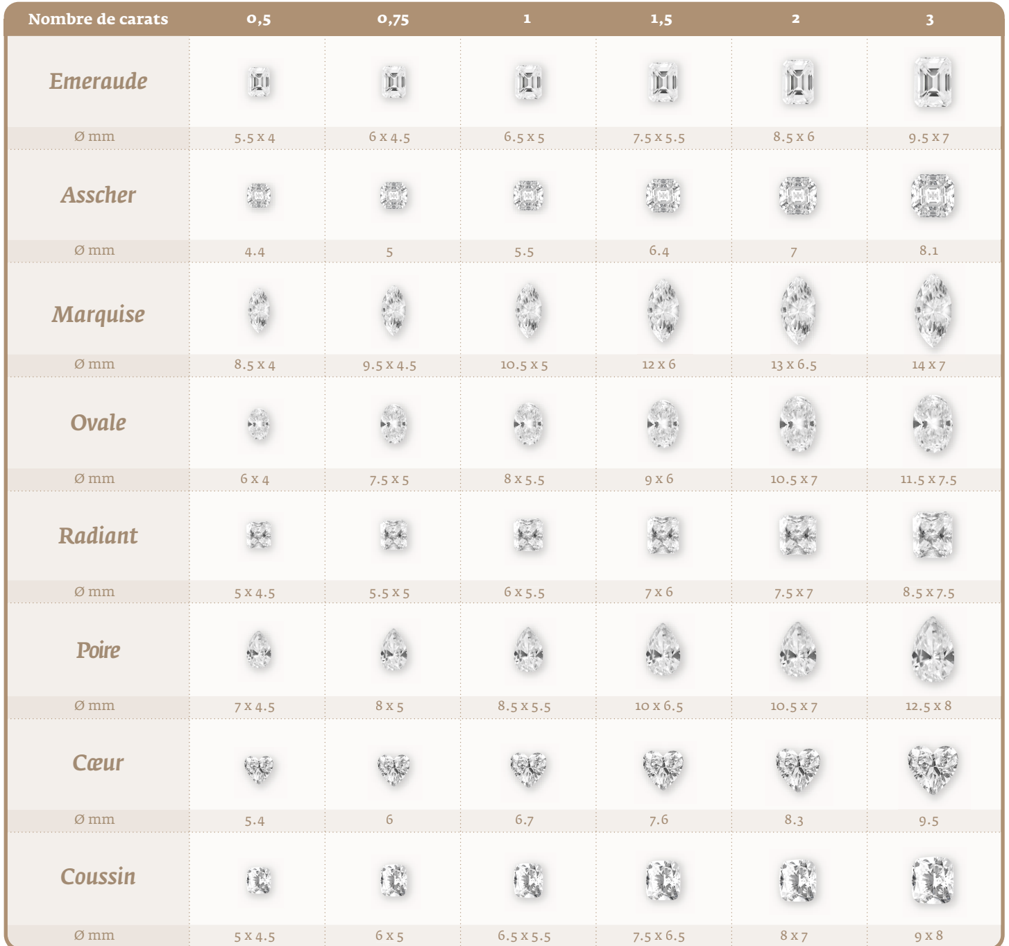
TABLEAU DIAMANT DE CORRESPONDANCE TAILLE ET POIDS

Les poids en carats sont valables pour des diamants de taille brillant d'une hauteur correspondant à 60% du diamètre du rondiste. Pour chaque % de hauteur en plus ou en moins, 2% doivent être retirés ou ajoutés. Merci de veiller à imprimer cette page sans la formater (changement d'échelle).